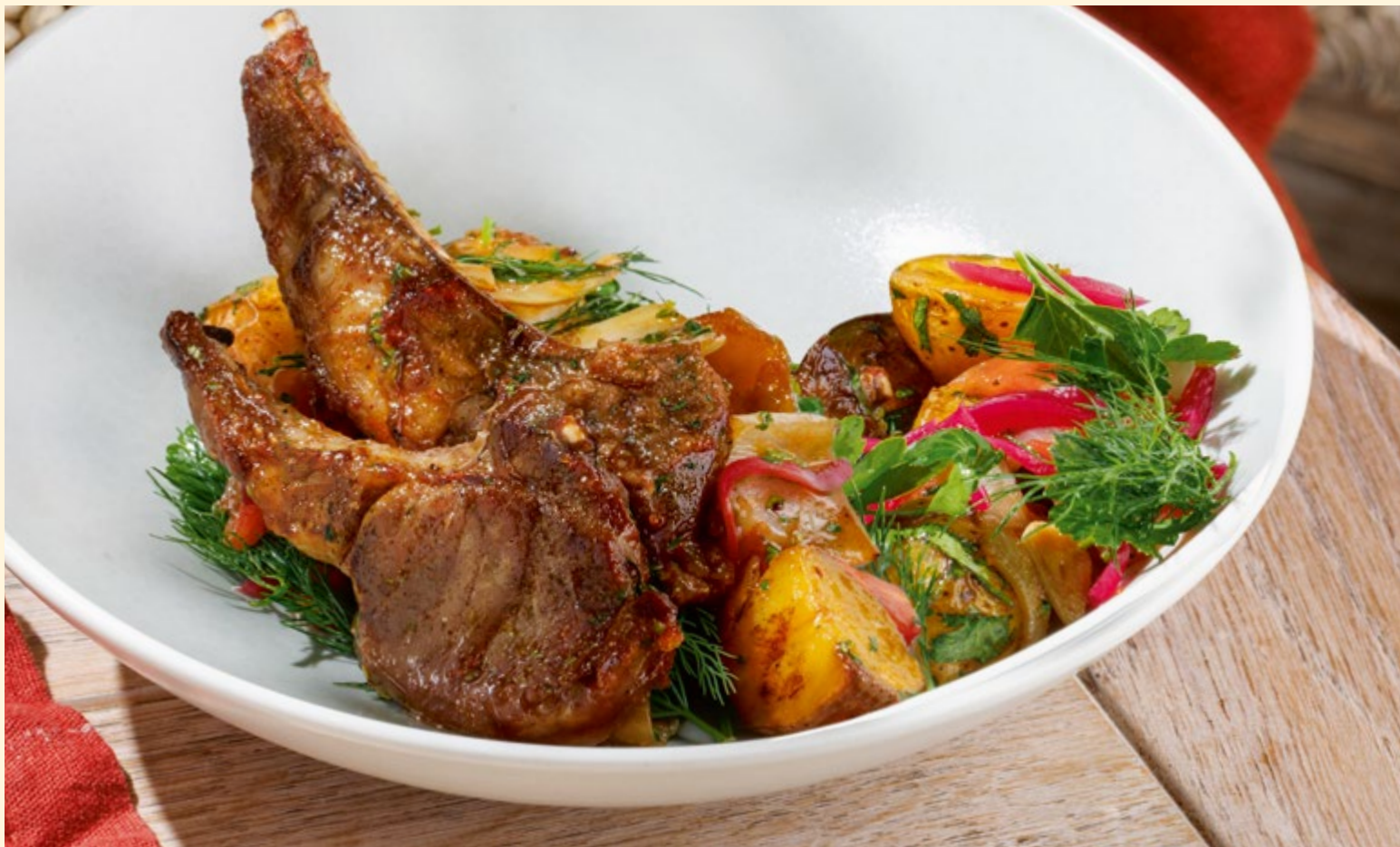
Оджахури из каре ягнёнка с печёным беби-картофелем, овощами и грузинскими специями _____ 990