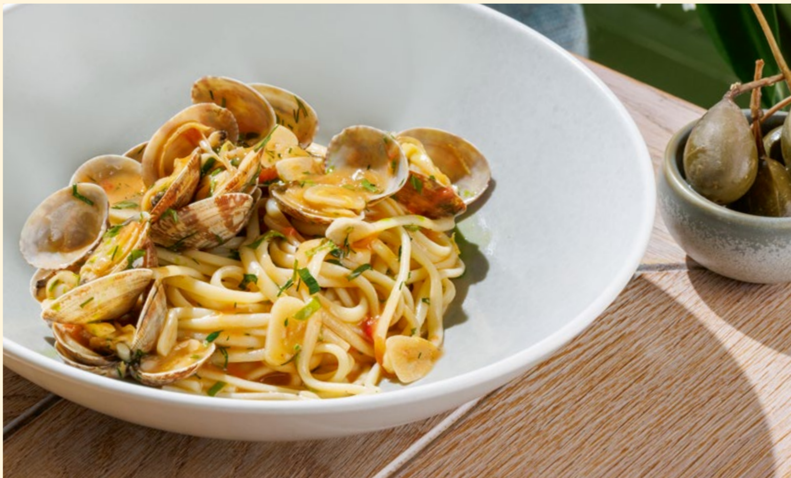
Паста с вонголе лингвини с моллюсками вонголе в соусе из белого вина