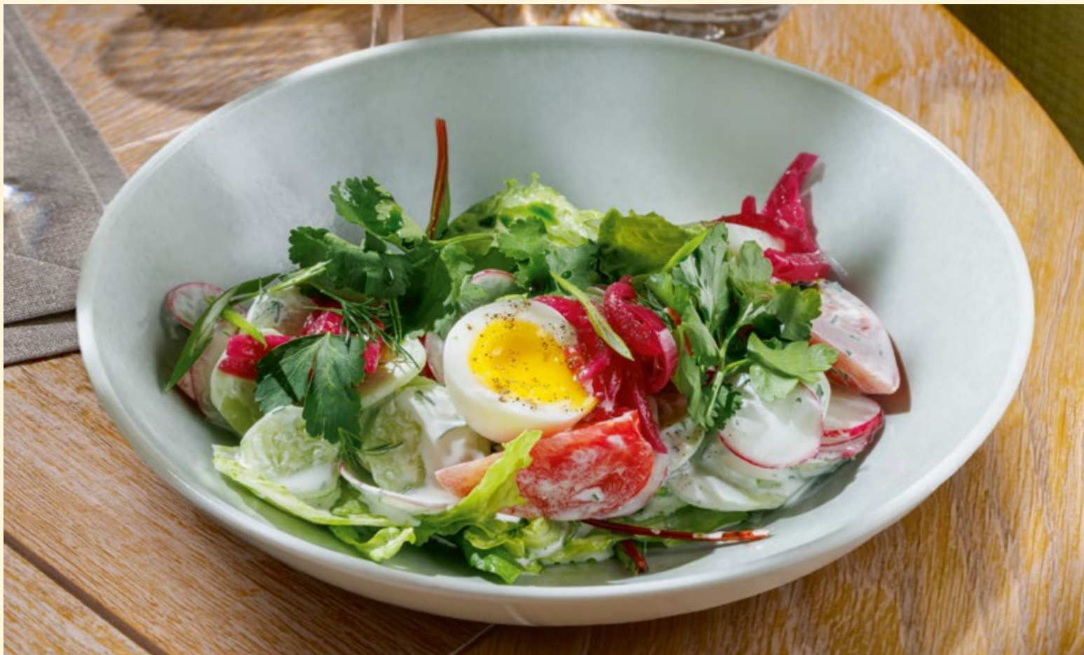
Летний салат со свежими томатами, редисом, яйцом и сметаной