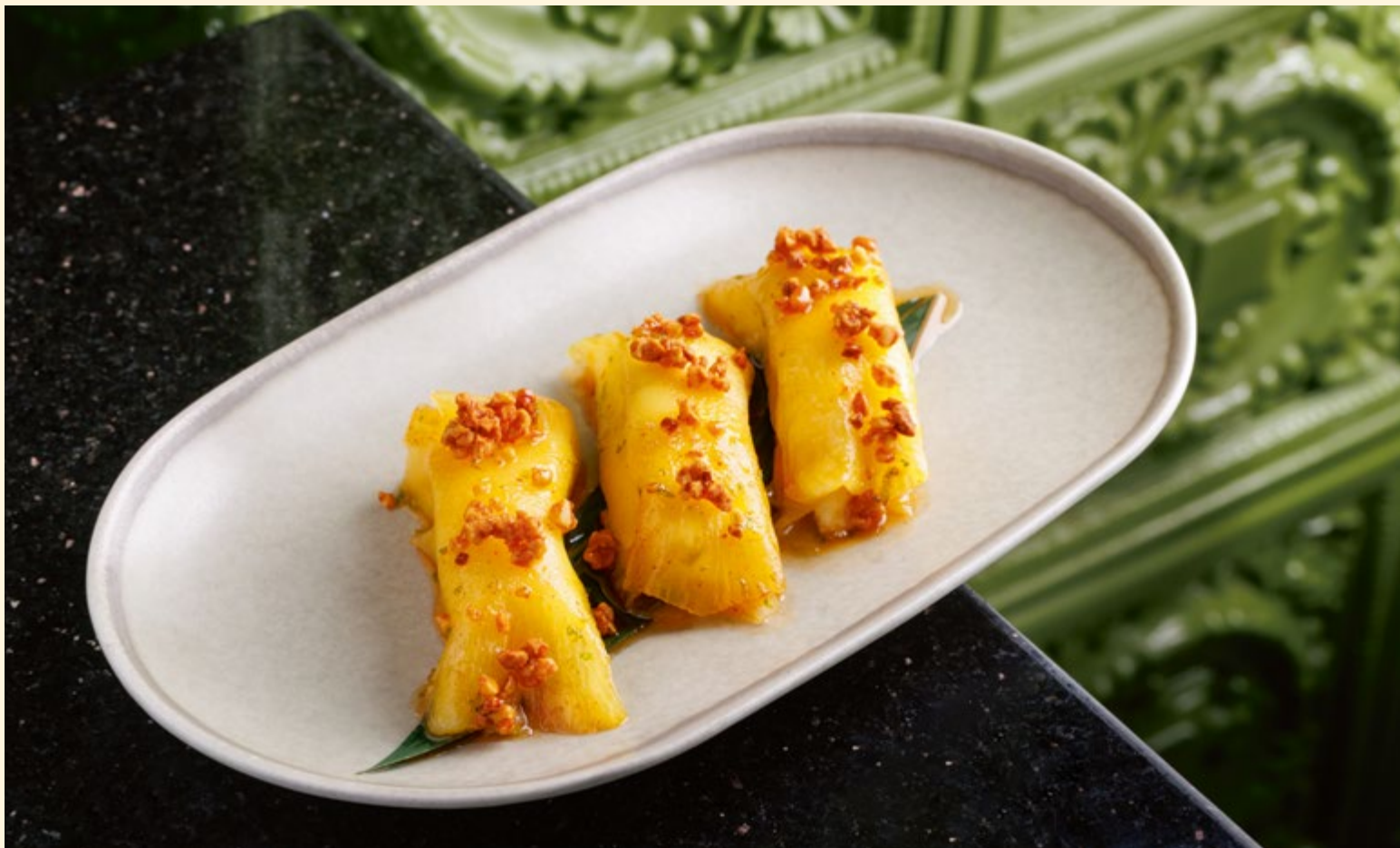
Гёдза из ананаса маринованные ананасы в соусе кимчи-лайм со сливочным кремом _____ 450