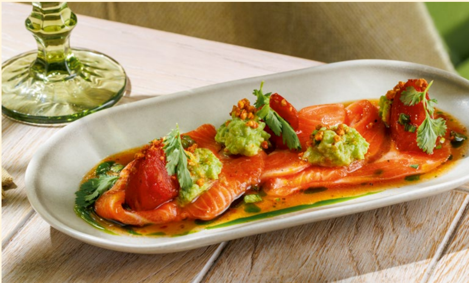
Севиче из лосося с мятым авокадо и томатами в соусе чили-лайм