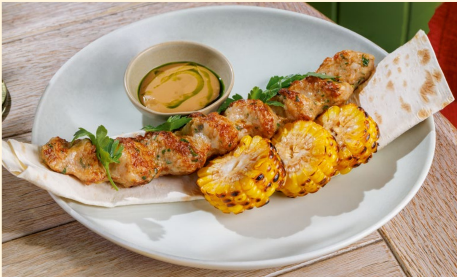
Люля-кебаб из креветок и цыплёнка с кукурузой на гриле и соусом сливочный демиглас _____ 650