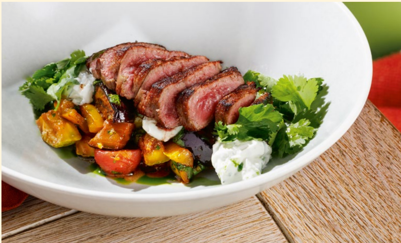
Стейк-салат с говядиной, овощами на гриле и соусом дзадзики