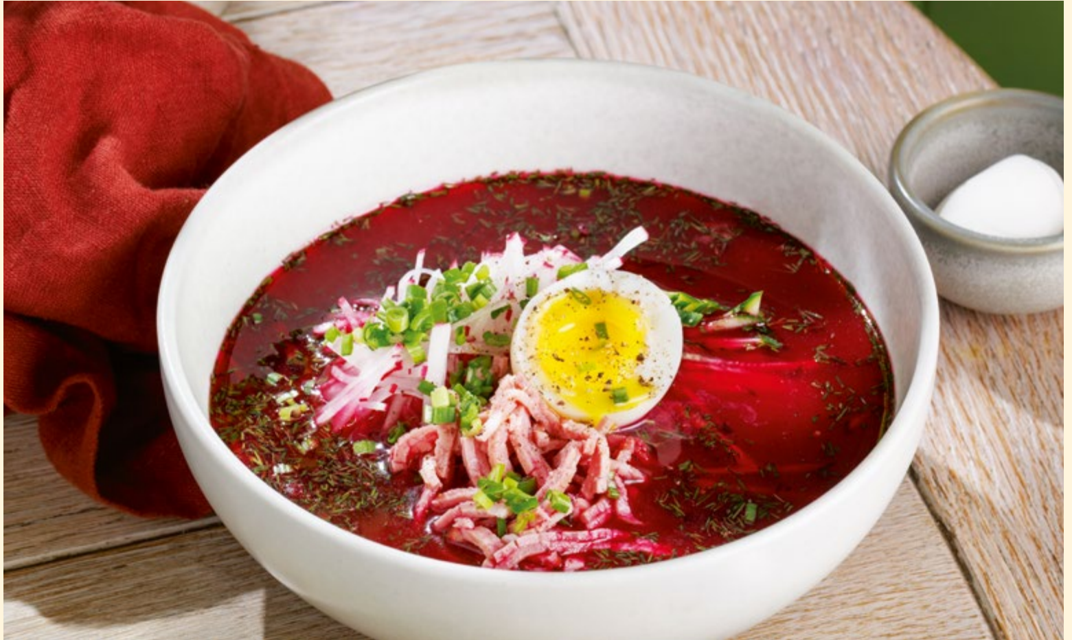
Холодный борщ с копчёной говядиной традиционный суп с печёной свёклой, овощами и яйцом _____ 490