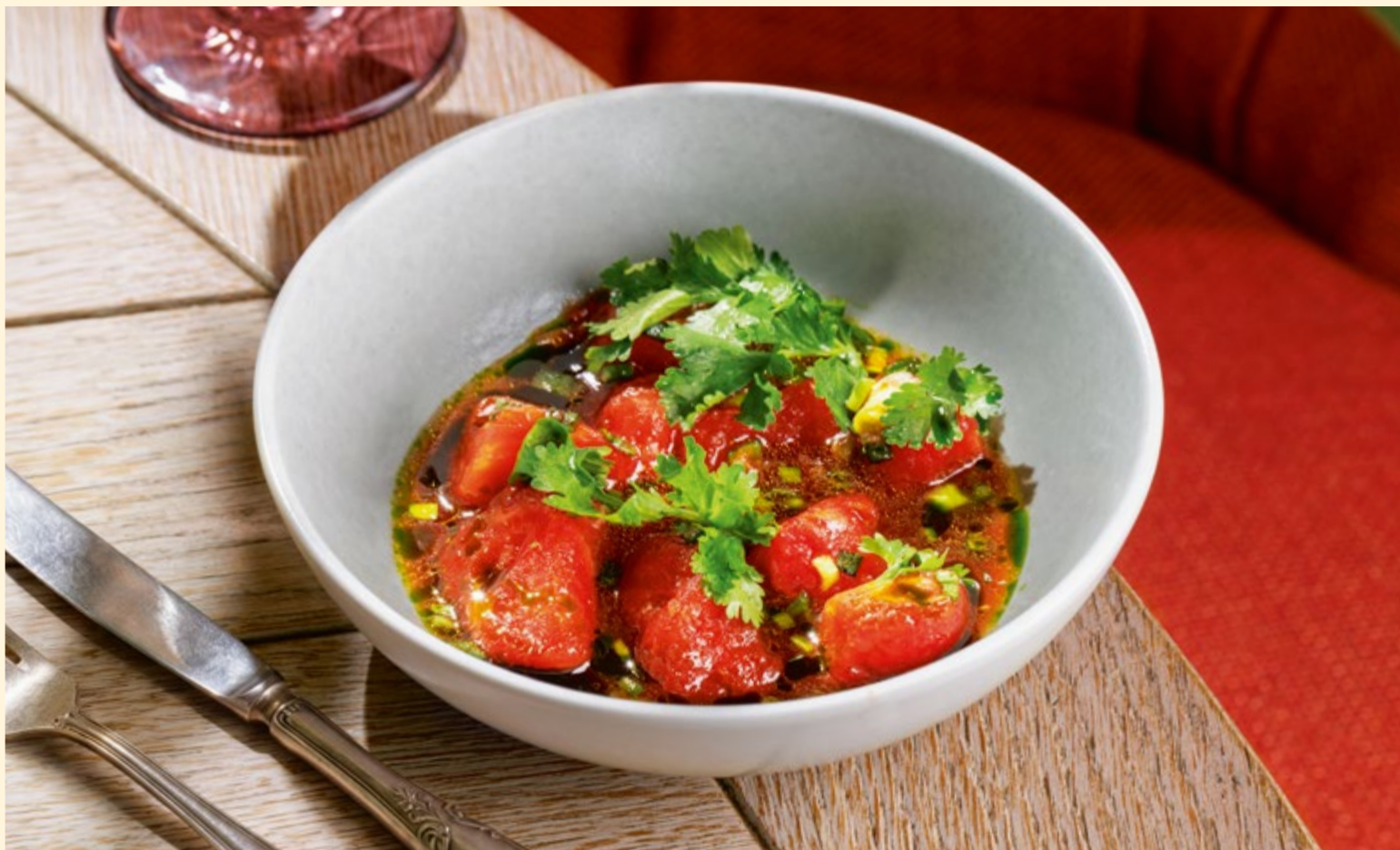
Томаты кимчи лёгкая закуска с маринованными томатами в остром соусе _____ 350