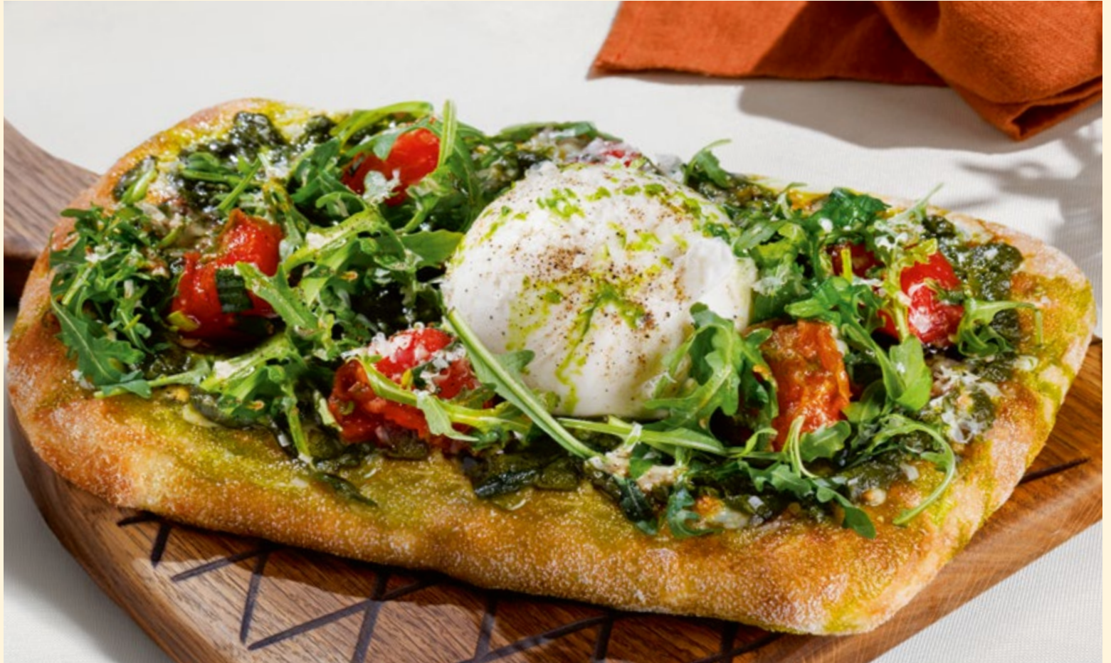
Римское хачапури с бурратой и восточным песто _____ 790