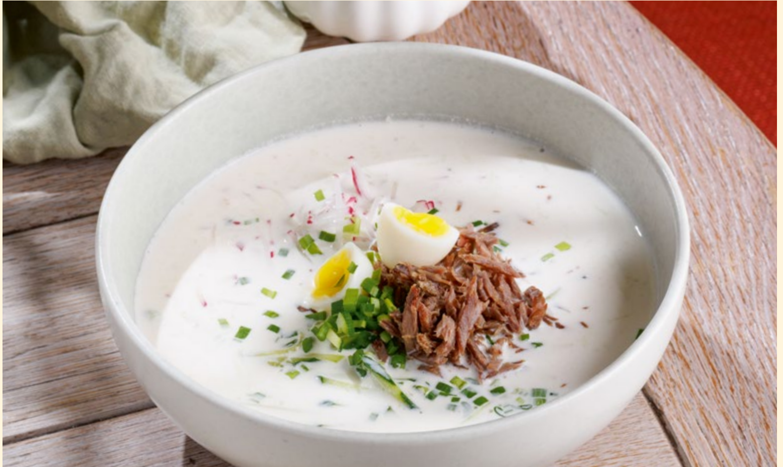
Окрошка с говядиной классическая окрошка на кефире с овощами и томлёной говядиной _____ 450